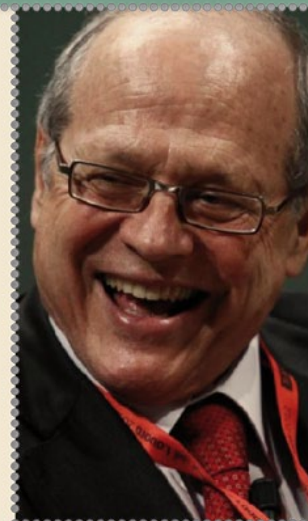
Tiziano Treu ministro di Prodi

http://ricerca.repubblica.it/repubblica/archivio/repubblica/1996/07/18/arriva-il-pacchetto-occupazione.html