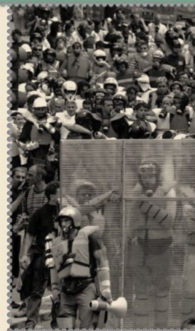
Al G8 di Genova

2007 il Trattato di Velsen sancisce la nascita di EUROGENDFOR , la gendarmeria europea con super-poteri con quartier generale a Vicenza