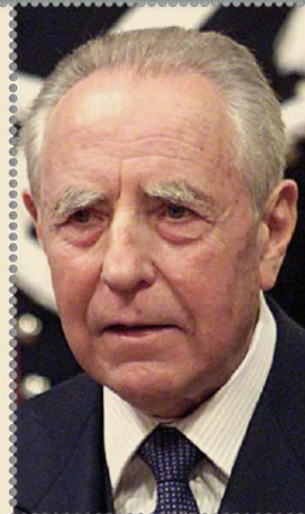
Carlo Azelio Ciampi

Governatore della Banca d'Italia ai tempi in cui forzò l'ingresso dell'Italia nell'Euro, poi Presidente della Repubblica, ruolo di garante fu tra i primi a vendere l'Italia a Banche e Mercati