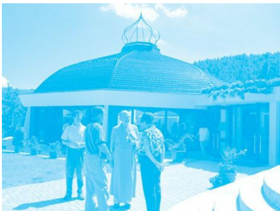
Swami Kriyananda davanti al Tempio di Luce nella comunità Ananda nei pressi di Assisi, mentre parla con alcuni ospiti.

Se desideri maggiori informazioni puoi visitare il sito www.ananda.it oppure telefonare allo 0742.813.620.